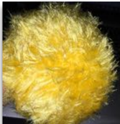
ungebürstet - gebürstet